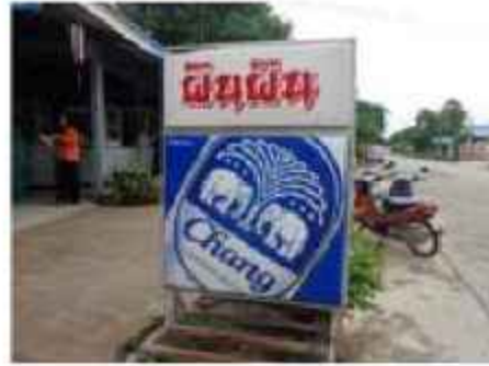
ป้ายแบบแขวนหน้าร้าน