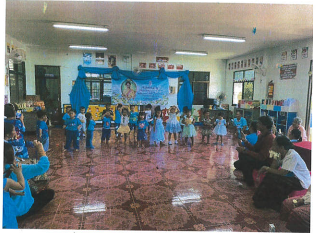
การแสดง ของเด็กนักเรียนศูนย์พัฒนาเด็กเล็กบ้านสระมะค่า เต้นประกอบเพลง รักแม่เท่าฟ้าและเรียงความเรื่องแม่