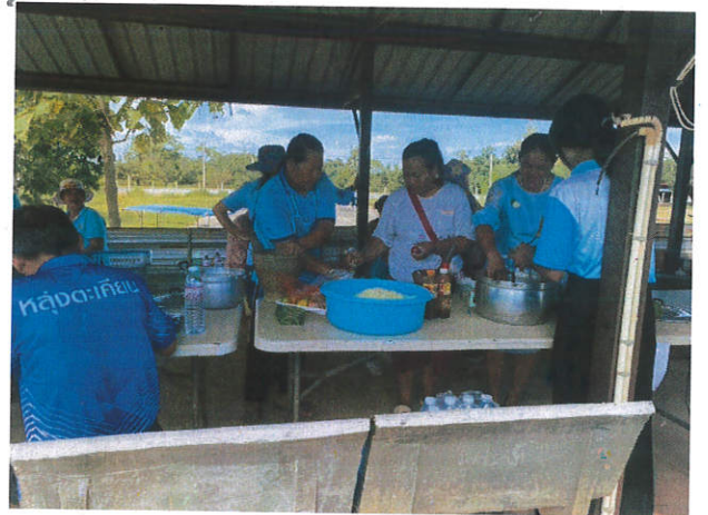
ร่วมรับประทานอาหารร่วมกัน