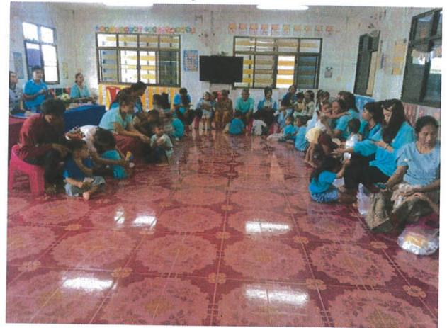
พิธีไหว้แม่